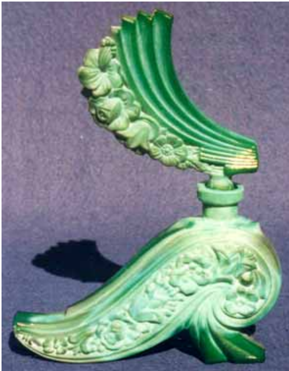
Abb. 2005-3/305 Flakon mit Stöpsel, Blumen-Dekor opak-jade-grünes Pressglas, H 19,8 cm Sammlung Stopfer vgl. MB Schmidt 1940/1946, Tafel 153, Nr. 4834/962/1

Die Flakons sind mit drei Ausnahmen durchwegs geschliffen. Die Flakons mit den Nummern 4834, 4833, Tafel 153, und 4836, Tafel 15, sind mit Pflanzenmustern dekoriert. Die Stöpsel sind überwiegend gepresst und können mit verschiedenen Flakons kombiniert werden. Die Flakons wurden mit 4-stelligen, die Stöpsel mit 3-stelligen Nummern bezeichnet.