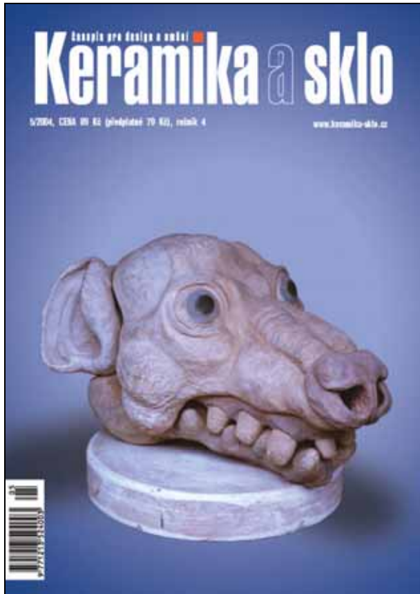
Abb. 2006-1/249 Keramika a sklo, Ausgabe 2004-5