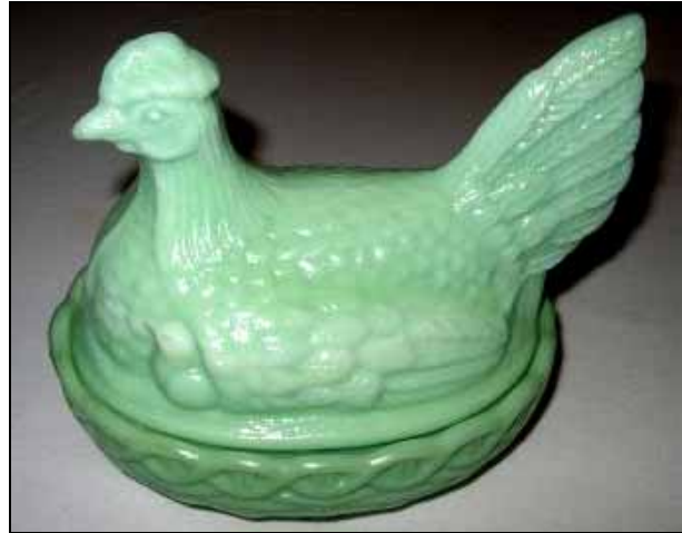
Abb. 2006-3/245 eBay FR, Art.Nr. 280001351099, €57,06 "poule sur nid, en verre opaline de couleur vert jade, bonbonnière, sucrier ... détail des plumes et de chaque coté, un poussin sort sous les ailes. Le nid est tressé façon osier, marqué dessous de la lettre S ", H 14 cm, B 11,5 cm, L 15,5 cm Smith: L. E. Smith Co., Mt. Pleasant, Pennsylvania, USA