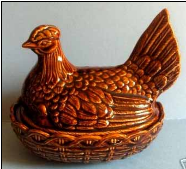
Abb. 2006-3/244 eBay UK, Art.Nr. 220004144216, €7,25, kein Gebot "PORTMEIRION CHICKEN EGG BASKET, Glazed" H 6.75" / 17 cm, B 6" / 15 cm, L 8" / 20 cm Smith: Portmeirion, USA

I also want to report that the book is packed up ready to send to the publisher tomorrow. I am sick to death of working on it. I have been working day and night since the middle of April. I will be sending you, on CD, all of the information and pictures in the book on European hen on nest dishes.