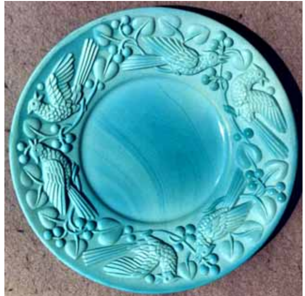
Abb. 2006-3/289 Teller mit Vogel-Muster (Kakadu?) opak-türkis-farbenes Pressglas, D 16,3 cm, glatter Rand Sammlung Stopfer ehem. Heinrich Hoffmann, Gablonz, 2. Hälfte 1930-er Jahre Entwurf A. Pfohl Jablonecké sklárny, Desná, ČSSR, nach 1950

Dazu musste eine neue Pressform angefertigt werden. Die Unterseite blieb gleich und trägt nach wie vor das Schmetterlingszeichen, obwohl Heinrich Hoffmann schon fast 20 Jahre lang nicht mehr lebte.