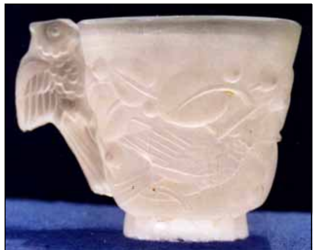
Abb. 2006-3/304 Tasse mit Vogel-Muster (Kakadu?) farbloses, mattiertes Pressglas, H 7 cm, D 6,7 cm Sammlung Stopfer ehem. Heinrich Hoffmann, Gablonz, 2. Hälfte 1930-er Jahre Entwurf A. Pfohl Hersteller unbekannt, Jablonecké sklárny?, ČSSR, um 2000

Sicher ist, dass sie nicht bei Ornela in Desná v Jizerských horách (heute JABLONEX Group a.s.) erzeugt wurden. Dazu ist neuerlich zu bemerken, dass diese Firma bemüht ist, die Qualität ihrer Erzeugnisse zu heben und ihre Produkte, zum Schutze des Käufers vor minderer Nachahmung, seit 2000 mit der sandgestrahlten Marke "DESNÁ" versieht, die auch 1. Qualität von 2. Qualität unterscheidet.