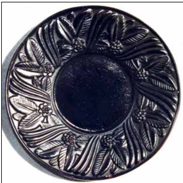
Abb. 2006-3/302 Teller mit Blätter-Bänder-Muster opak-schwarzes Pressglas, D 11 cm Sammlung Stopfer Heinrich Hoffmann, Gablonz [Jablonec], 2. Hälfte 1930-er Jahre Entwurf A. Pfohl