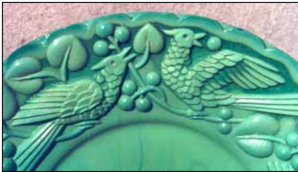
Abb. 2006-3/288 Teller mit Vogel-Muster (Kakadu?) opak-jade-farbenes Pressglas, D 16,3 cm, glatter Rand Sammlung Stopfer ehem. Heinrich Hoffmann, Gablonz, 2. Hälfte 1930-er Jahre Entwurf A. Pfohl Jablonecké sklárny, Desná, ČSSR, nach 1950