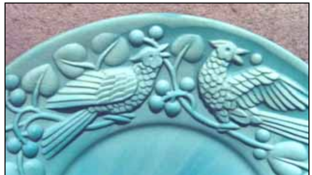
Abb. 2006-3/290 Teller mit Vogel-Muster (Kakadu?) opak-lapis-farbenes Pressglas, D 16,3 cm Sammlung Stopfer ehem. Heinrich Hoffmann, Gablonz, 2. Hälfte 1930-er Jahre Entwurf A. Pfohl Jablonecké sklárny, Desná, ČSSR, nach 1950