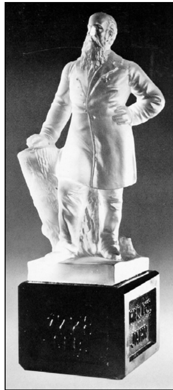
Abb. 1999-5/076 a Büste eines Unbekannten mit Bart farbloses Pressglas, säure-mattiert, H 6,5 cm Sammlung Stopfer s. MB Riedel, Polaun, um 1885, Tafel 118, Nr. 548

Abb. 1999-5/066 Statuette Friedrich Ludwig Jahn (1778-1852) farbloses Pressglas, säure-mattiert, H 23 cm Sockel schwarzes Pressglas, auf dem Sockel eingepresste Inschrift „Friedrich Ludwig Jahn - 1778 geb. - 1852 +“ Sammlung Geiselberger PG-324 PK 2007-3: wohl Josef Riedel, Polaun, um 1880/1885 vgl. Sellner 1995, S. 141, Abb. 186 vgl. Baumgärtner 1981, Abb. 368 Baumgärtner: Gegossene Ganzfigur auf schwarzem Sockel, [...] Deutschland oder Böhmen, zweite Hälfte 19. Jahrhundert“