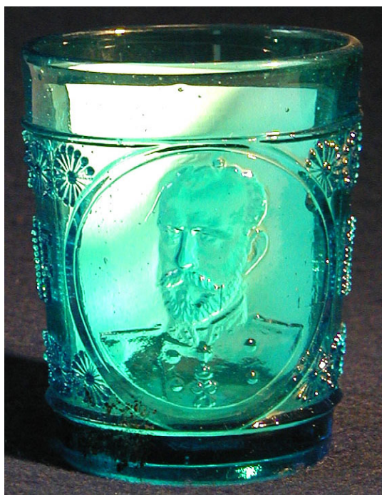
Abb. 2004-3/212 Becher Kronprinz / Erzherzog Rudolf von Habsburg punktierte Inschrift „KRONPRINZ RUDOLF“, Mäander blaues Pressglas, H 7,9 cm, D 6,2 cm Sammlung Geiselberger PG-785 Mariánská hut', S. Reich & Co., Krásno, Mähren, um 1889