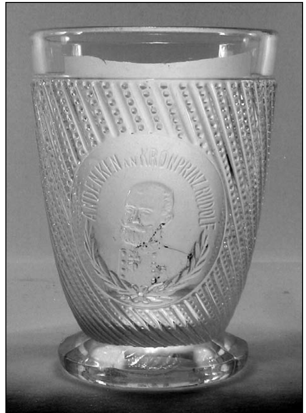
Abb. 2008-1/221 AUKRO Art.Nr. 298686768, KČ 355 / € 13,75 (Januar 2008) „SKLENICE ANDENKEN an KRONPRINZ RUDOLF“