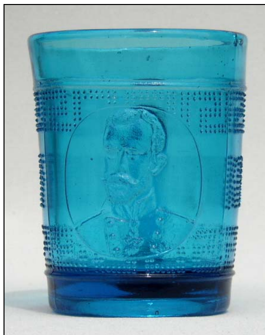
Abb. 2003-3/396 Becher und Teller Kronprinz / Erzherzog Rudolf von Habsburg punktierte Inschrift „ANDENKEN AN KRONPRINZ RUDOLF“ blaues Pressglas, Teller H 2 cm, D 12,8 cm Becher H 7,8 cm, D 6,3 cm Sammlung Geiselberger PG-668 und PG-715 Mariánská hut', S. Reich & Co., Krásno, Mähren, um 1889

Abb. 2004-3/212 Becher Kronprinz / Erzherzog Rudolf von Habsburg punktierte Inschrift „KRONPRINZ RUDOLF“, Mäander blaues Pressglas, H 7,9 cm, D 6,2 cm Sammlung Geiselberger PG-785 Mariánská hut', S. Reich & Co., Krásno, Mähren, um 1889