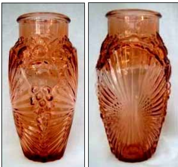
Abb. 2003-2/294, Abb. 2003-2/295 und Abb. 2003-4/355 Vase, formgeblasen, rosé-farben, H 26 cm, D 13 cm „signiert „S und N“, Zahl „84“ und „BIS“, Manufaktur Schneevogt, Frankfurt, 1920-er Jahre“

PK 2003-2, SG: Bei eBay Deutschland wurde Mitte April eine signierte Vase als Art Déco Pressglas der 1920-er Jahre der Manufaktur Schneevogt in Frankfurt angeboten (Artikelnummer 3322522247 bzw. 3347050419). „Diese Glasvase hat eine hervorragende Ornamentik; das Material ist in einem angenehmen rose-Ton. Laut einem Bekannten handelt es sich hier um ein original Sammlerstück aus der Zeit von der Manufaktur SCHNEEVOGT in Frankfurt / Main . Auf dem Boden sind übereinander die Buchstaben „S und N“ eingepreßt, darunter die Zahl „84“ und daneben „BIS“. Die Vase ist 26 cm hoch und misst im maximalem Durchmesser 13 cm. Ein wirklich schönes Sammlerstück aus der Zeit, mit minimalsten Altersspuren!“