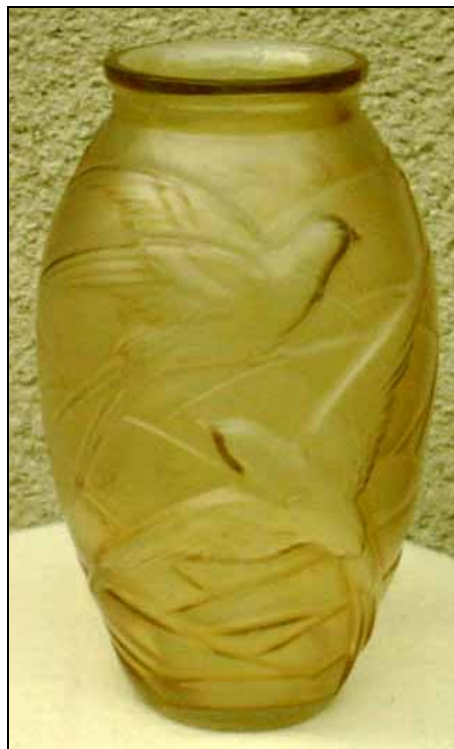
Abb. 2003-4/263 und Abb. 2003-4/264 eBay FR, Art.Nr. 3340078707, € 45.50 „GRAND VASE ART DÉCO, Ce grand vase est en verre moulé de couleur légèrement fumé. Le décor en relief présente sur chaque face deux oiseaux (martinets) [Segler?] l'un en vol et l'autre perché. Il faut noter la présence de bulles. Il est signé en relief des lettres S et N entrelacées (J. Schreiber & Neffen - 1930) et numéroté 253 également en relief. ... “ H 25 cm, D de l'embase 8,2 cm, D du col 9,3 cm Farbe bernstein SG: Manufaktur Schneevogt, Frankfurt, 1920-er Jahre“

Die Markierung beider Vasen ist identisch bis auf die unterschiedlichen Nummern. Die Vase mit den Schwalben oder Mauerseglern [martinets] ist also sicher der Manufaktur Schneevogt in Frankfurt zuzuschreiben und nicht „J. Schreiber & Neffen - 1930“!