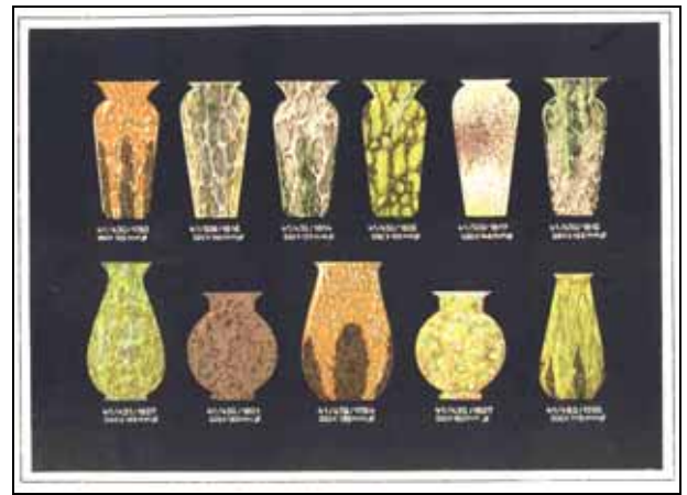
Abb. 2009-4-02/003 und Abb. 2009-4-02/004 MB Reich / ČMS Beleuchtungsglas 1935-1939 Lampenschirme und -füße, Archiv Rona Crystal