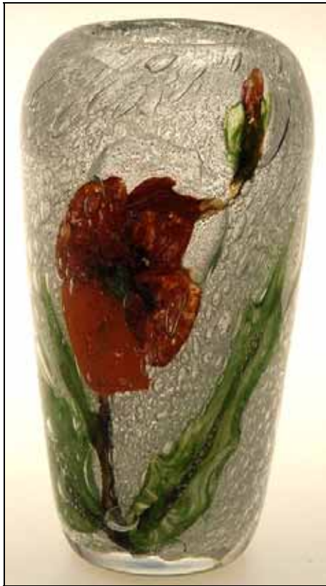
Abb. 2011-2/149 Vasen, Českomoravské sklárny a.s., nach 1934 Moravská galerie v Brně, Umělecká produkce Českomoravských skláren ve 40. letech 20. století www.moravska-galerie.cz/moravska-galerie/ vystavy-a-program/aktualni-vystavy/2011/ umelecka-produkce-cm-sklaren-(102-126).aspx