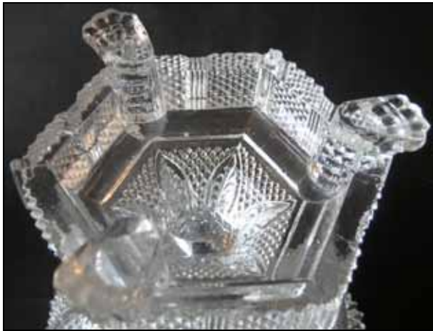
Eine dritte Fußschale mit rundem Fuß PV-0505 hat einen Durchmesser von 15,5 cm und eine Höhe von 13,2 cm (siehe Musterbuch LH von 1840, Planche 8, No. 681 ).