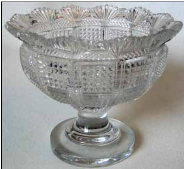
Abb. 2011-2/006 Fußschale mit rundem Fuß, Bleikristall, Deckel & Teller fehlen Palmetten- & Diamantenmuster farbloses Pressglas H 13,2 cm, D 15,5 cm Sammlung Vogt PV-0505 s. MB Launay, Hautin & Cie. 1840, Planche 18, No.1235 (S 1 . L.) "Compotier f o . étrusque, Assiette de Compotier"