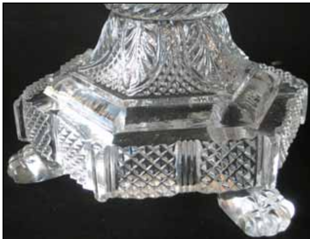
Abb. 2011-2/004 Fußschale mit 3 Löwentatzen, Bleikristall Palmetten-, Blätter- & Diamantenmuster farbloses Pressglas H 15,5 cm, D 16,1 cm Sammlung Vogt PV-1541 s. MB Launay, Hautin & Cie. 1840, Planche 18, No.1240 S t . L. "Sucrier f o . étrusque m. à griffes, m. à carrés, diamants et filets"

Die Fußschale mit 3 Löwentatzen PV-1541 ist ebenfalls im Musterbuch Launay, Hautin & Cie. von 1840 auf Planche 18, No. 1240 S t . L. , zu finden. Die Maße: Durchmesser 16,1 cm, Höhe 15,5 cm.