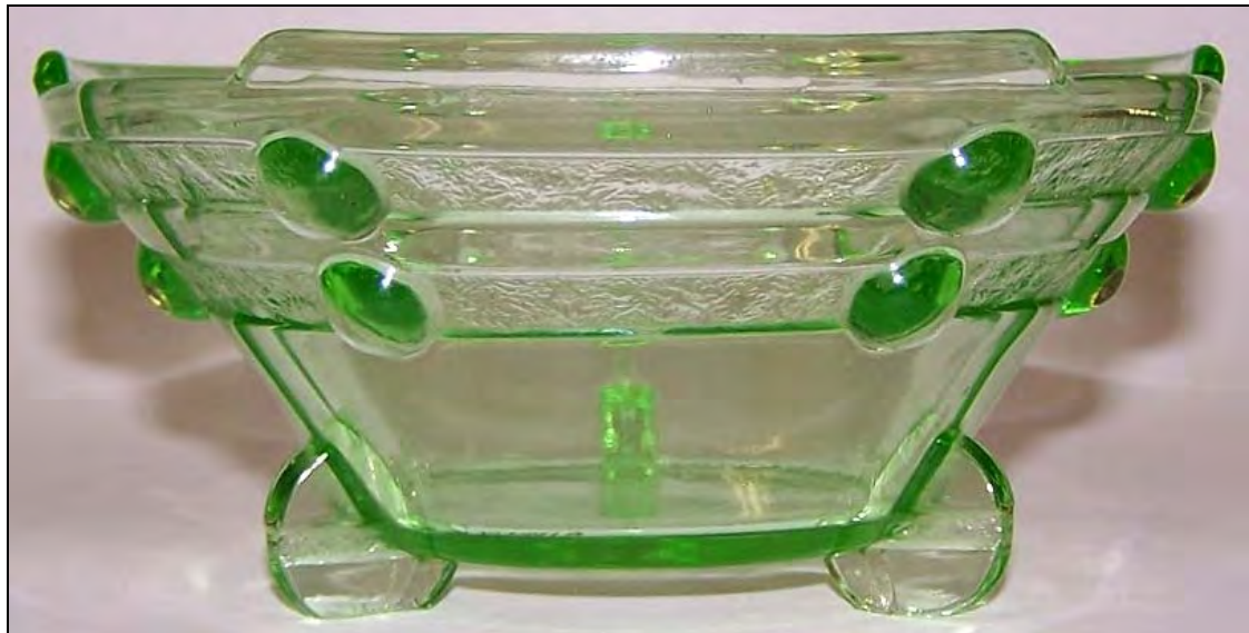
Abb. 2011-3/247 (Maßstab ca. 100 %)

Schale mit Reifen und Doppelpunkten, grünes Pressglas, H 6,3 cm, D 14,2 cm