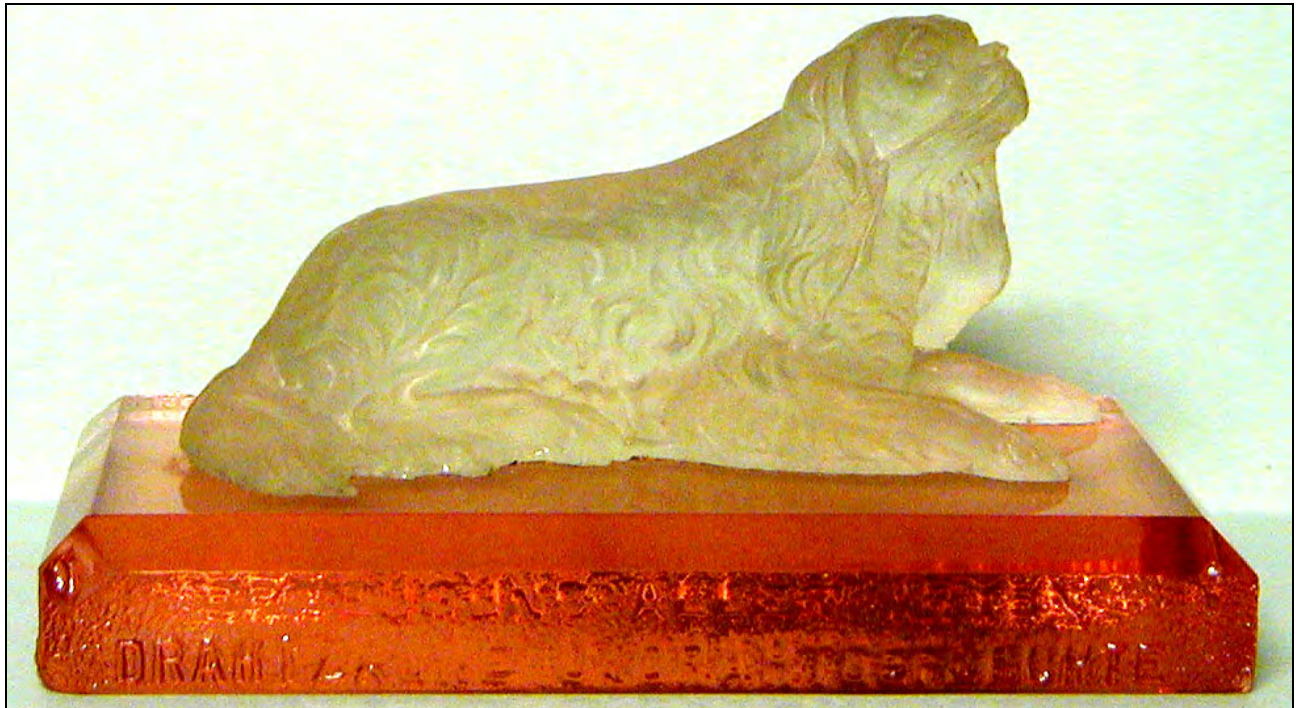
Abb. 2005-3-01/089 (Ausschnitt)