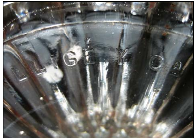
Abb. 2010-1/225b → Leuchter „Torero“ und „Spanierin“ farbloses Pressglas, H 27,3 cm, D 12 cm Sammlung Vogt PV-728 & PV-729 eingepresst: „BARCELONA LLIGÉ Y CA.“ Cristalerías San Miguel, Fábrica de cristal Lligé, Barcelona um 1900

La fábrica tiene sus orígenes en la Fábrica de cristal Lligé que de Barcelona se trasladó a Badalona en marzo de 1956 y se fundó como cooperativa en 1957 . La empresa se dedica a la fabricación de artículos de vidrio soplado según el tradicional proceso artesanal, principalmente para la hostelería , la restauración y el regalo. El recorrido por la fábrica permite conocer las diferentes fases de elaboración de este producto: creación del horno, fundición de materiales, soplado, enmoldado, cocción y acabados.