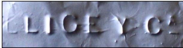
Abb. 2011-4/058 Schale mit großen Sternen, Ranken- und Gittermuster, opak-weißes Pressglas mit Kaltvergoldung, H 4,1 cm, D 6 cm Sammlung Jeschke gefunden in Madrid, innen im Boden eingepresste Marke „LLIGE Y C As “ (Llige & Co.) vgl. PK 2010-1, Vogt, SG, Leuchter „Spanierin“ und „Torero“, Fábrica de cristal Lligé, Barcelona, Cristalerías San Miguel, um 1900

Abb. 2011-4/057 Schale mit großen Sternen, Ranken- und Gittermuster, opak-weißes Pressglas mit Kaltvergoldung, H 4,1 cm, D 6 cm Sammlung Jeschke gefunden in Madrid, innen im Boden eingepresste Marke „LLIGE Y C As “ (Llige & Co.) vgl. PK 2010-1, Vogt, SG, Leuchter „Spanierin“ und „Torero“, Fábrica de cristal Lligé, Barcelona, Cristalerías San Miguel, um 1900