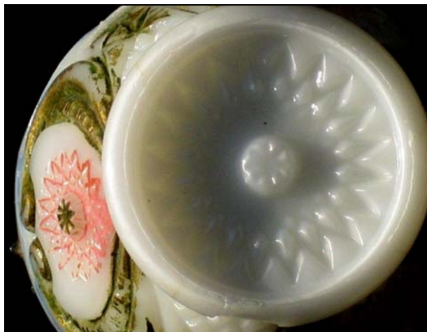
Abb. 2011-4/059 Schale mit Diamantenmuster, opak-weißes Pressglas mit Kaltvergoldung, H 3,3 cm, D Rand 6 cm Sammlung Jeschke gefunden in Madrid, innen im Boden eingepresste Marke „LLIGE Y C As “ (Llige & Co.) vgl. PK 2010-1, Vogt, SG, Leuchter „Spanierin“ und „Torero“, Fábrica de cristal Lligé, Barcelona, Cristalerías San Miguel, um 1900