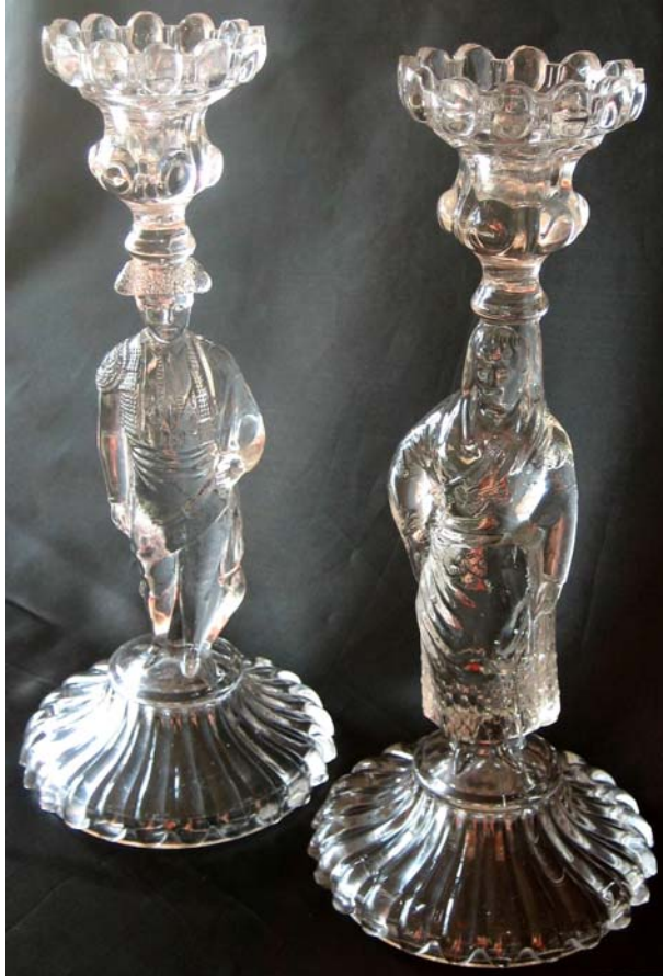
Abb. 2010-1/225a Leuchter „Torero“ und „Spanierin“ farbloses Pressglas, H 27,3 cm, D 12 cm Sammlung Vogt PV-728 & PV-729 eingepresst: „BARCELONA LLIGÉ Y CA.“ Cristalerías San Miguel, Fábrica de cristal Lligé, Barcelona um 1900

PK 2010-1, SG: Die Cristalerías San Miguel / Fábrica de cristal Lligé, Barcelona , müssen schon lange vor 1956 existiert haben, als sie nach Badalona verlegt wurden. Heute produziert das Glaswerk vor allem Glas für Hotels und Restaurants. Mehr werden wir wahrscheinlich nicht heraus finden - schade!