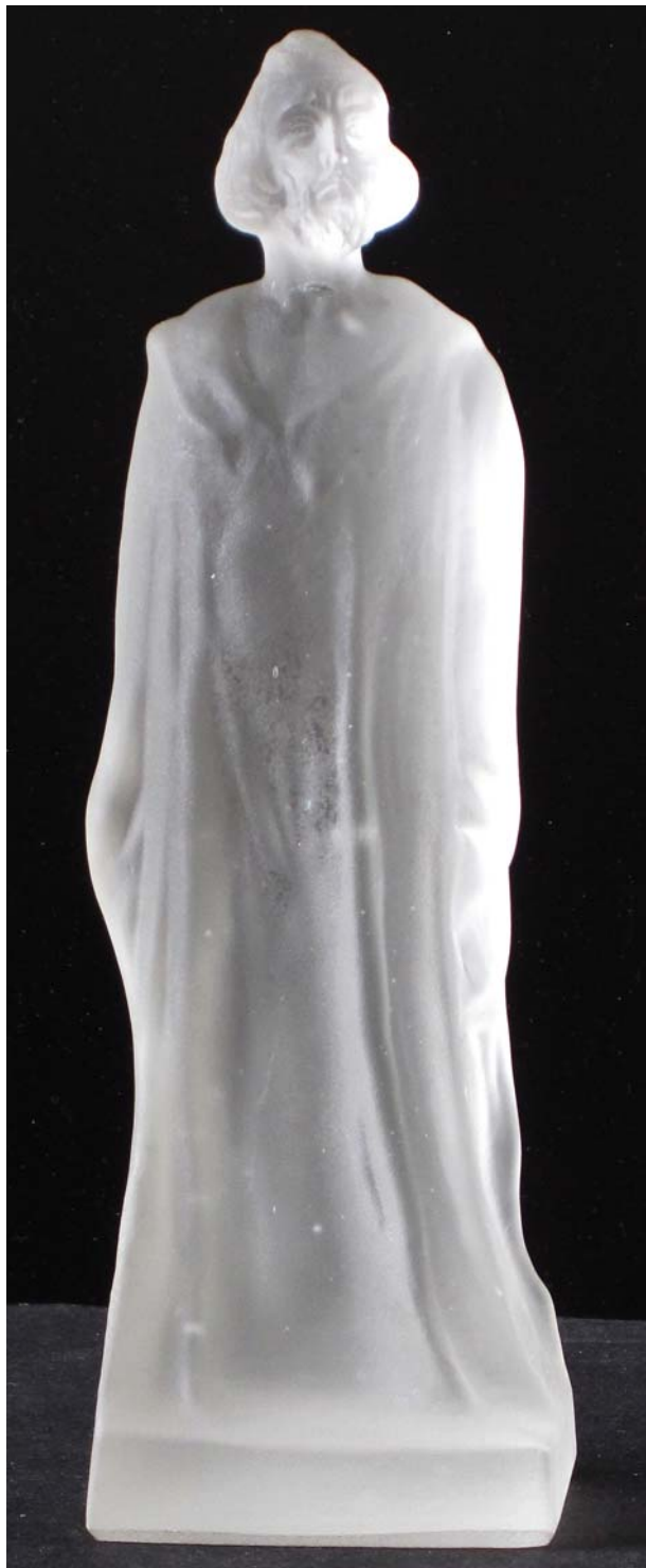
Abb. 2013-1/40-02 (Maßstab ca. 115 %) Kleine Figur „Jan Hus“ farbloses Pressglas, mattiert, H 16,6 cm, B 5,1 x 4,7cm Sammlung Maierholzner Hersteller unbekannt, Tschechoslowakei, nach 1918