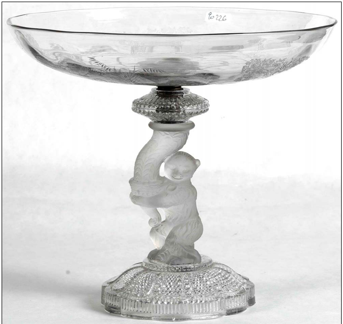
Abb. 2016-2/20-01 (Maßstab ca. 70 %)

Flache Schale, geblasenes und graviertes farbloses Glas, D ca. 24 cm, H insg. 26 cm