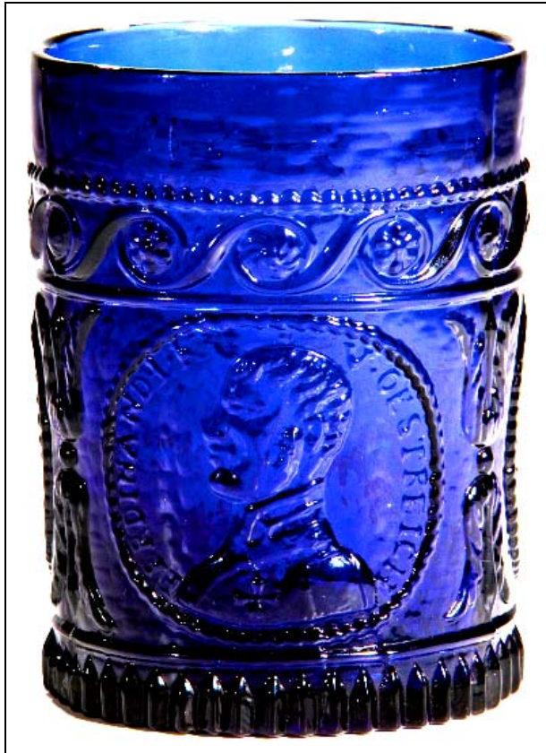
Abb. 2000-5/181; Becher, „in die Form geblasen“ →