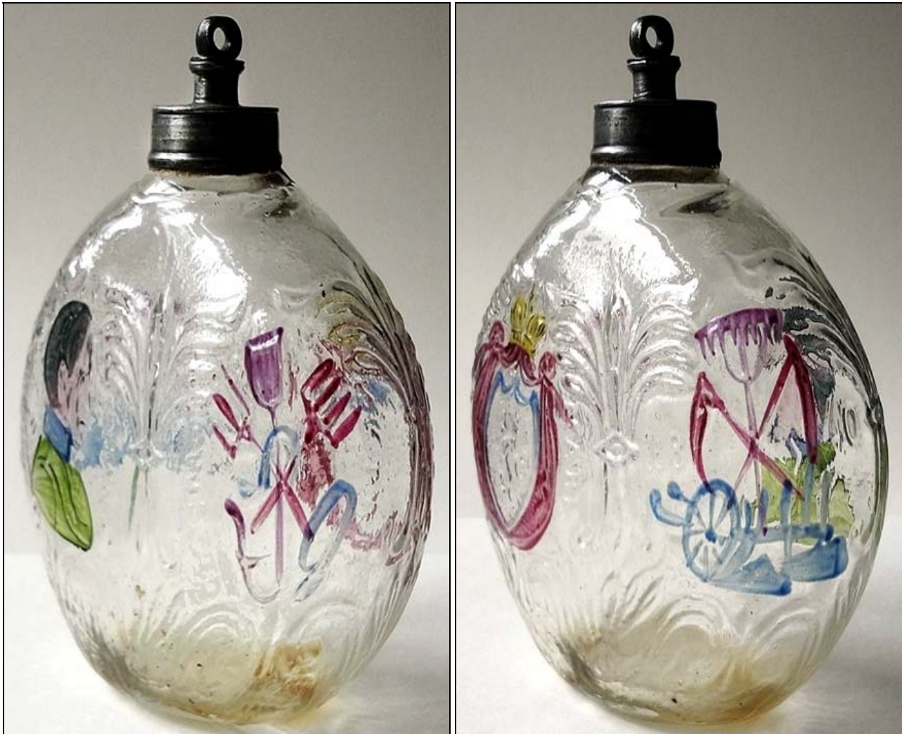
Abb. 2017-1/06-04; Glashütte Benedict Vivat, Langerswald / Langerswald, ehemaliges Herrenhaus, Bachergebirge / Pohorje, Slowenien (Foto Andreas Bernhard, Oktober 2016)

Tschuttera „Erzherzog Johann“ , form-geblasenes, farbloses Glas, bunt bemalt, H ursprünglich ca. 15 cm, Zinnschraubverschluss Aufschrift: „ E-HERZOG JOHANN “, Pflug, Rechen, Sense und Dreschflügel, Jahreszahl „ 1840 “ Emblem aus Gabeln, Spaten, Säge, Messer, Aufschrift: „ GLASFAB. D. B. V. K. K. PRIV. “, Wappen Panther und „ STEYERMARK “ Benedikt Vivat, Langerswald, Herzogtum Steyermark, 1840 , aus AK Eibiswald 1978, Kat.Nr. 92 und Kat.Nr. 97 Privatsammlung, vgl. Sammlung Stopfer