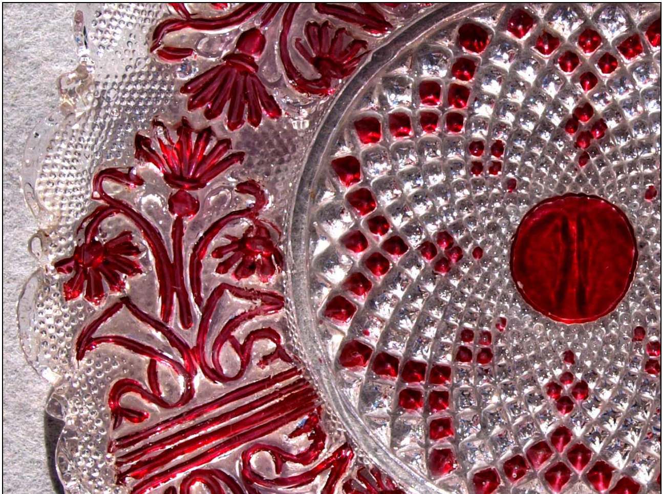
Abb. 2017-1/09-02; Teller mit Ranken und Blüten, Grund regelmäßig fein gekörnt / Sablée, Rand mit breiten Bögen und Zacken ausgeschliffener Heftnabel, Spiralen aus Diamanten im Spiegel, farbloses Pressglas, rot gebeizt, H 1,8-2,2 cm, D 13-13,3 cm Sammlung Stopfer Hersteller unbekannt, Böhmen, um 1830

SG: Die feine und sehr korrekte „ Bemalung “ konnten die Frauen oder Kinder, die sie als „ Heimarbeit “ zuhause machten, nur durch eine Farbbeize mit feinen Pinselfen auftragen, wenn die Beize mit geeigneten Füllstoffen so zäh vorbereitet wurde, dass sie nicht verlaufen konnte. Wenn die Beize sehr zäh war, konnten auch Fehlstellen entstehen, weil die Metallionen nicht in das Glas eindringen konnten. Je nach der Herstellung konnten Beizen durchsichtig oder auch opak sein. Beizen unterschieden sich deshalb technisch stark von