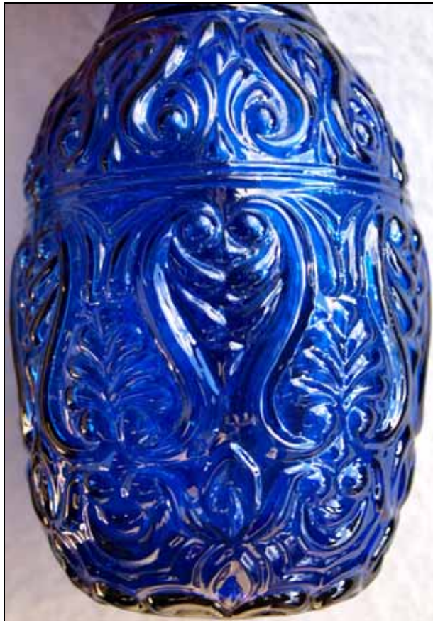
Abb. 2011-1/005 Karaffindel mit Palmetten, Lilien und Muscheln, mit Abriss kobalt-blaues, form-geblasenes Glas, H 19,4 cm, D 8 cm Sammlung Stopfer Ferdinandstal / Staritsch, Eibiswald, um 1850 s. AK Altes steirisches Glas, Eibiswald 1978, Bildteil Seite ohne Nr., Kat.Nr. 103