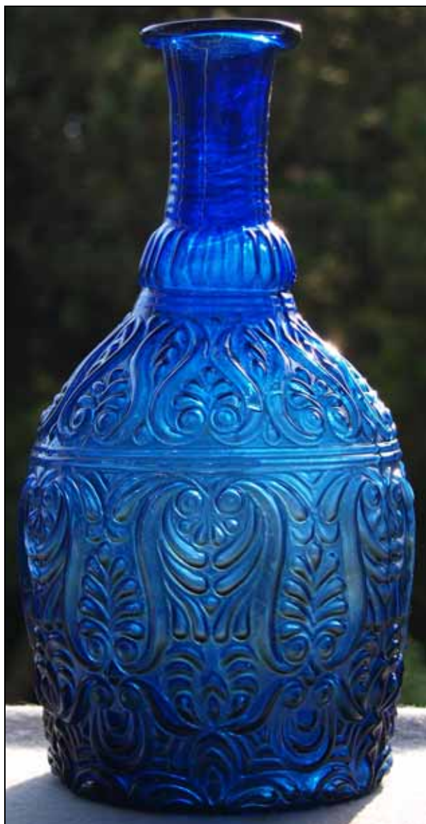
AK Altes steirisches Glas, Eibiswald 1978, Kat.Nr. 103:

Abb. 2011-1/002 Karaffe mit Palmetten, Lilien und Muscheln, mit Abriss kobalt-blaues, form-geblasenes Glas, H 26,3 cm, D 11 cm Sammlung Stopfer Ferdinandstal / Staritsch, Eibiswald, um 1850 vgl. AK Altes steirisches Glas, Eibiswald 1978, Bildteil Seite ohne Nr., Kat.Nr. 103