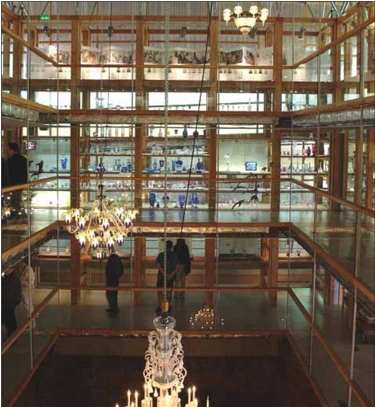
Abb. 2010-4/381 Museum „La Grande Place - Musée du Cristal Saint-Louis“ der Cristallerie Royal